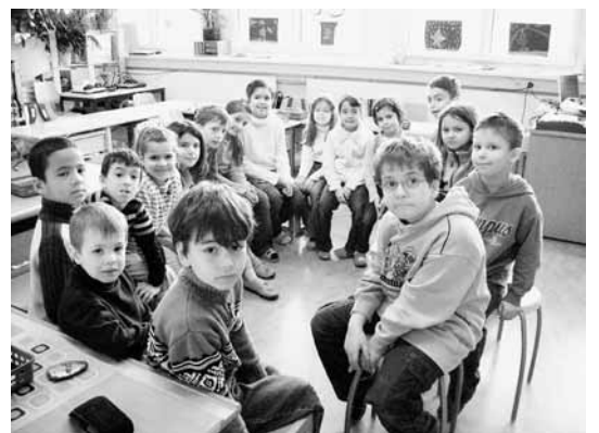
Der Klassenrat ist ein Zeitfenster, in dem Klassen alle aktuellen Themen besprechen können.