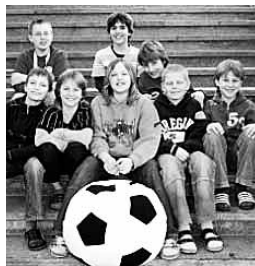
Die Schülerinnen und Schüler freuen sich über den selbstgenähten Sitzfussball.