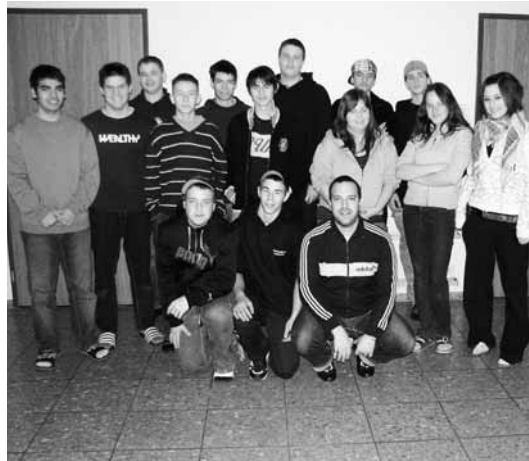
Gerade bei Realschülerinnen und -schülern ist es wichtig, diese ehrlich auf die Welt nach dem Schulzimmer vorzubereiten.

Diesen Veränderungen müssen auch die Berufswahl und Lehrstellensuche gerecht werden. Gerade auf der Realstufe ist es ungemein wichtig, die Schülerinnen und Schüler realistisch und ehrlich auf die Welt nach dem Schulzimmer vorzubereiten. Dieser Anspruch ist durchaus nicht immer so einfach zu erfüllen, wie es auf den ersten Blick scheinen mag. Im Vordergrund steht immer ein Mensch, mit Wünschen, Bedürfnissen und Vorstellungen, aber natürlich auch mit Fähigkeiten und Fertigkeiten, welche nicht immer ganz kongruent sind mit Ersterem. Es liegt hier in der Verantwortung der Klassenlehrperson, den Jugendlichen ihre Möglichkeiten aufzuzeigen und schmackhaft zu machen. Ein nicht immer einfaches Unterfangen, welches meistens nur mithilfe der Eltern zufriedenstellend gelingt. Ein starker Trumpf im