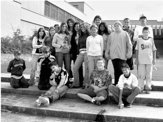
Die 1. Realklasse vor ihrem «neuen» Schulhaus.

Die Unterstufe verbrachte ich im Hof, die Mittelstufe im Dorf. Jetzt gehe ich in den Hof, in die Oberstufe. Ich erwarte, dass es viel mehr Hausaufgaben gibt und Prüfungen. Ich denke, dass die Lehrer strenger sind. Es hat sich sehr viel geändert, sie geben nicht mehr so genaue Antworten. Es geht zack zack. Wir besprechen nicht lang. Mir gefällt das Pausenlädeli sehr gut, und ich kaufe mir fast jeden Tag ein Brötchen und einen Apfelmoss. Die Mitschüler sind auch sehr nett, manchmal nerven sie, aber sie sind okay. Die Lehrer machen die Schule