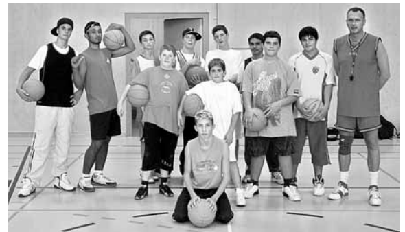
Neben Capoeira, Tennis, Volleyball und Badminton gibt es neu ab diesem Semester einen Basketballkurs im Schulsport.